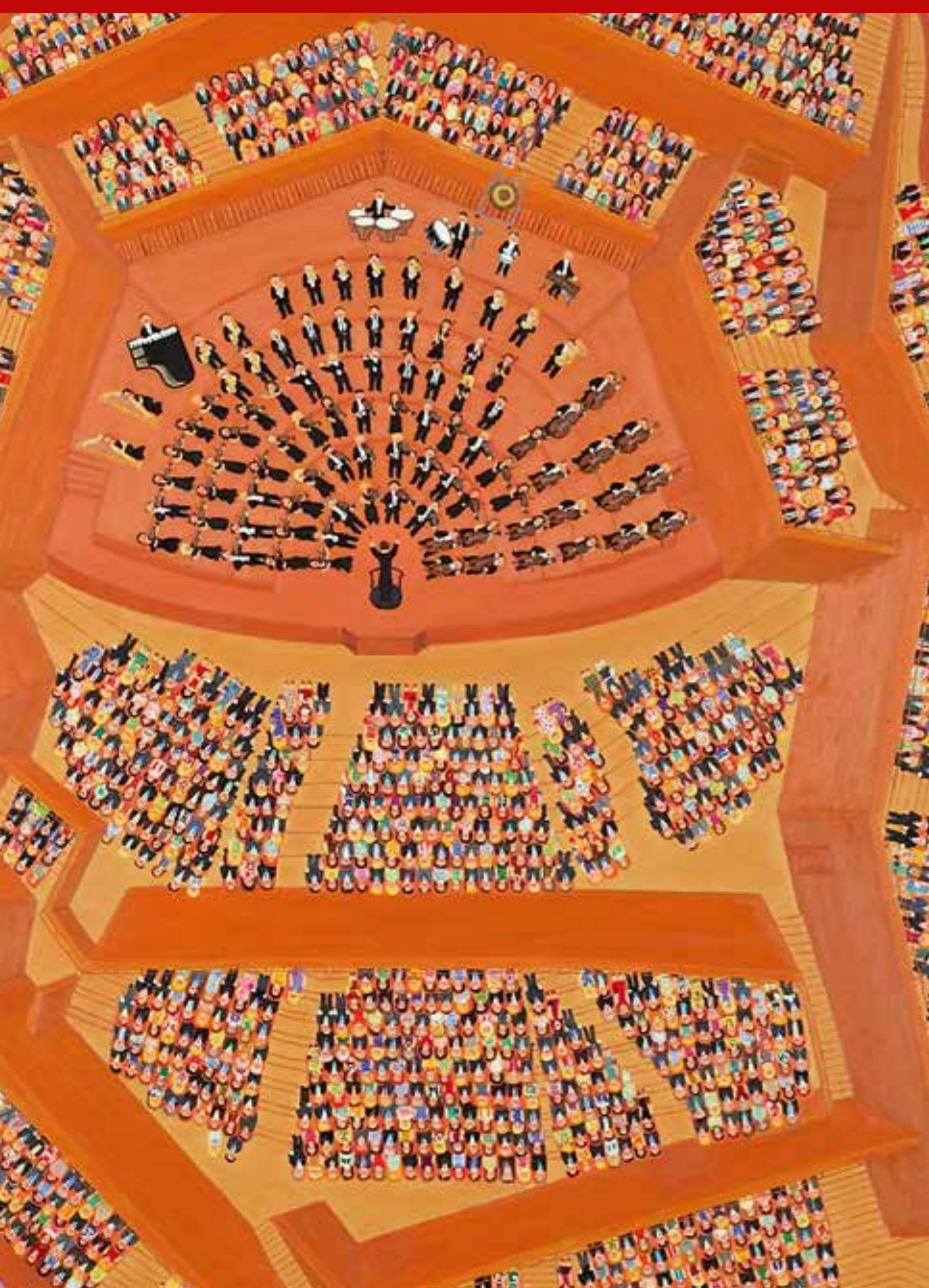
»Koncert i koncertsalen« (Udsnit) 150 x 130 cm