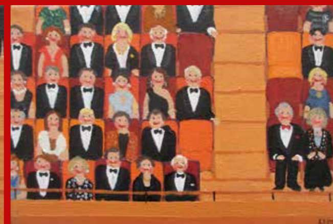
»Poul Schlüter, Poul Nyrup Rasmussen og Lars Løkke + co - og bl.a. en tidligere undervisningsminister« 12 x 17 cm