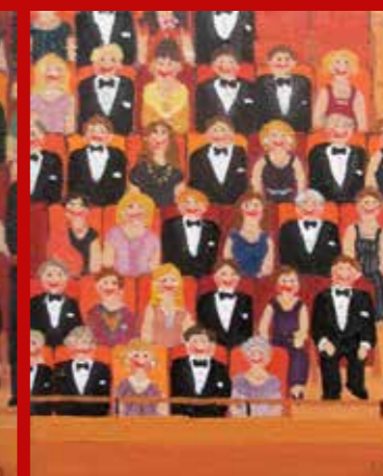
»Industriens bosser - med formanden for dansk Industri i spidsen« · 19 x 15 cm