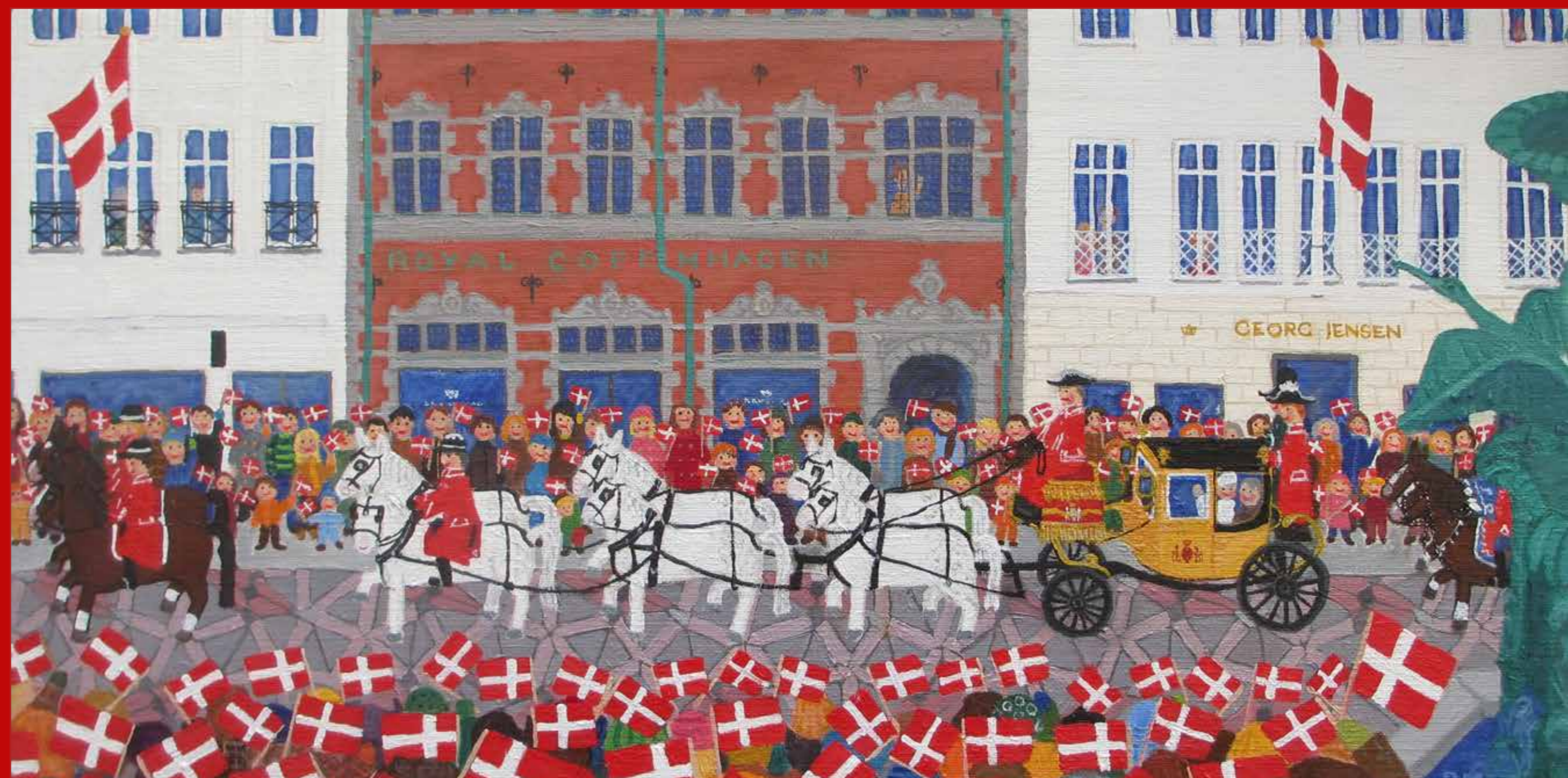
»Karettur 14. januar. Dronning i 40 år. Ved Storkespringvandet« · 30 x 60 cm