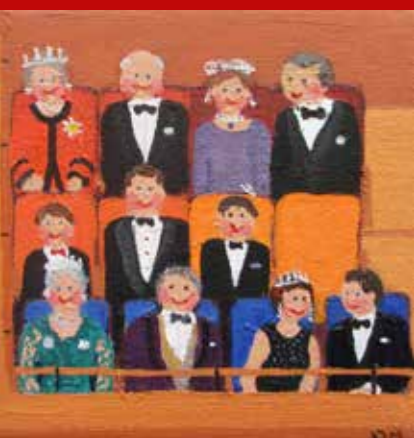
»Kongeløgen« 12 x 12 cm